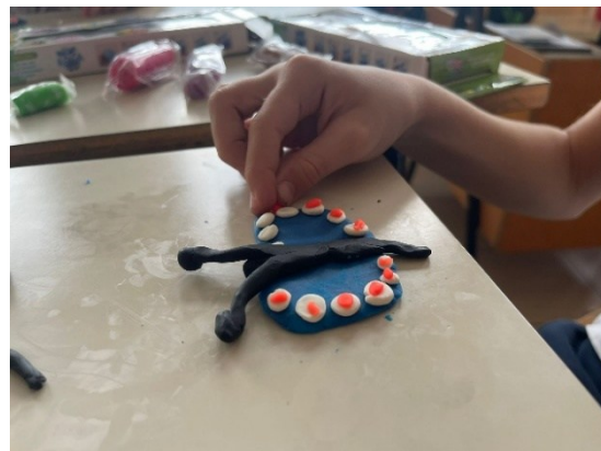
Figura 5 e 6: lavoriamo insieme per realizzare la farfalla.