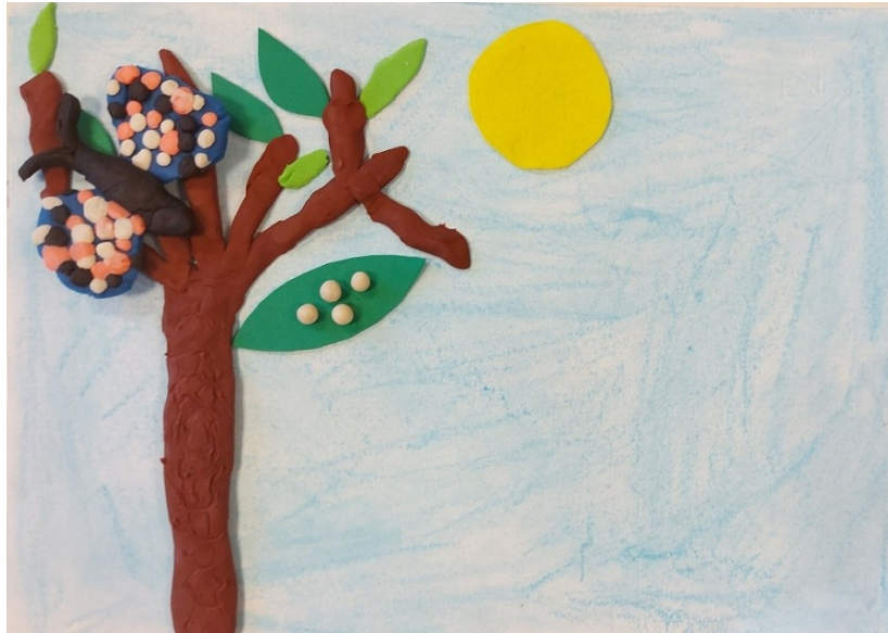
Figura 7: un fotogramma del corto animato, visionabile all'indirizzo https://drive.google.com/file/d/12JkXhDQVhDbQuUhkSj5OFNjLCsGINAPv/view?usp=sharing