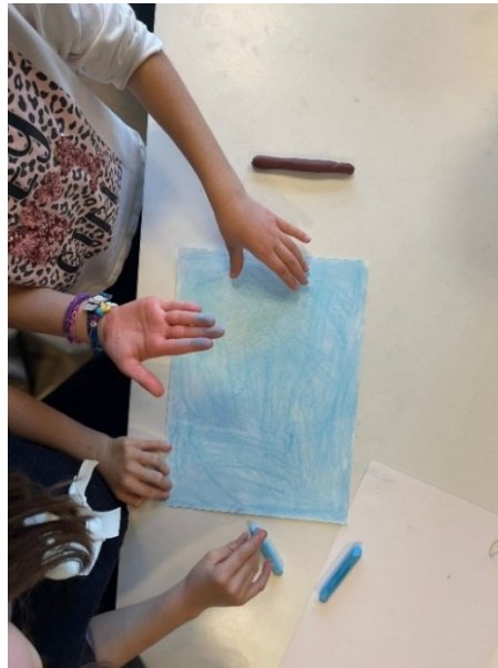
Figura 1 e 2: le ambientazioni: la notte e il giorno.